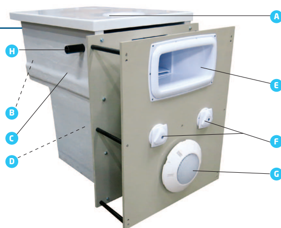
Schéma de principe d'un GS14 VT E